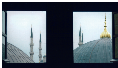
la foto vincitrice